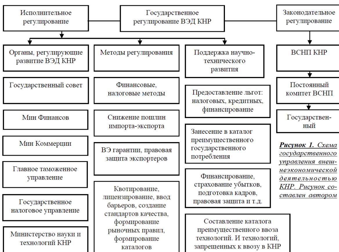
Рисунок 1. Схема государственного управления внешнеэкономической деятельностью КНР. Рисунок составлен автором

Управление внешнеэкономической деятельностью напрямую осуществляет Министерство коммерции и приданные ему для этого подразделения, но такие функции, как формирование пакета законов о налогообложении и обложении товаров таможенными пошлинами, решаются на уровне других государственных подразделений, активно участвующих в управлении внешнеэкономической деятельностью КНР [33].