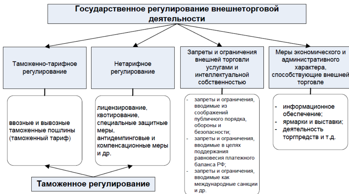
Рис. 1.1. Государственное регулирование внешнеторговой деятельности

Государственное регулирование внешней торговли является составной (и наиболее объемной) частью государственного регулирования ВЭД. Основными методами государственного регулирования внешней торговли выступают тарифные и нетарифные ограничения экспорта и импорта товаров (рис. 1). К тарифным относится, прежде всего, применение таможенных пошлин и налогов, что позволяет регулировать экспортные и импортные товарные потоки сугубо экономическими методами. Нетарифными (административными) методами государственного регулирования внешней торговли являются регистрация, лицензирование, квотирование и контингентирование, экспортный, импортный и валютный контроль, декларирование товара, система различных льгот.