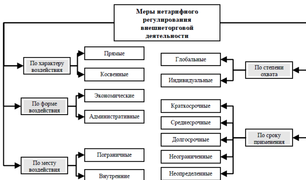
Рис. 3. Классификация нетарифных мер

Классификация нетарифных мер представлена на рисунке 3. В соответствии с логикой унификации правил международной торговли основным вариантом классификации нетарифных мер становится схема, разработанная ВТО. Нетарифные меры – модернизирующийся инструментальный сегмент внешнеторгового регулирования. Развитие нетарифного инструментария происходит в рамках общего курса ВТО на либерализацию мировой торговли, одним из направлений которого является последовательная тарификация мер государственного регулирования международной торговли [70, с. 64].