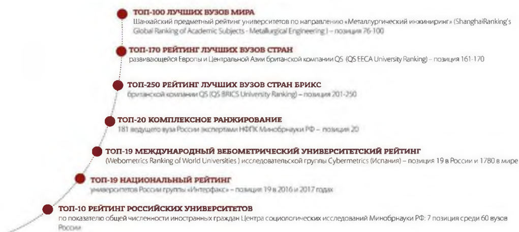
Рис. 2 Позиции НИУ «БелГУ» в научно-образовательном пространстве

Согласно российским рейтингам положение вуза также является достаточно высоким и стабильным. По данным национального рейтинга университетов группы «ИНТЕРФАКС» НИУ «БелГУ» занимает 19 место среди 264 российских университетов [5] и 5 место среди 89 вузов в списке востребованных классических университетов России в рамках проекта «Социальный навигатор» [6].