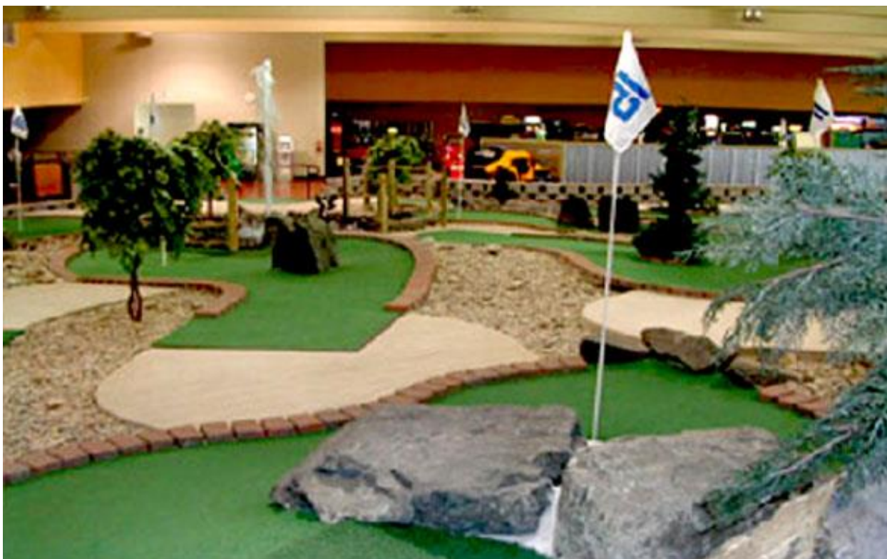
Рисунок 1. Визуализация проекта