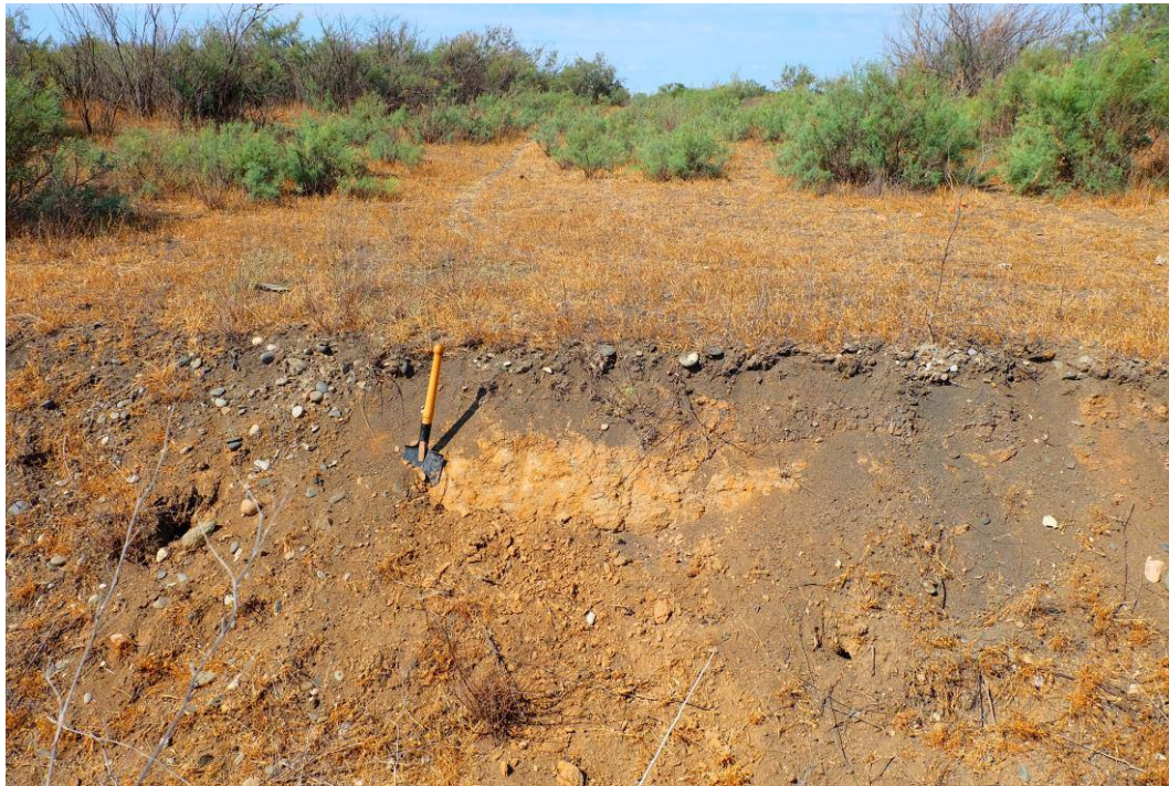
Рис. 5. Желтовато-серые пески в основании гривистых урочищ, сформировавшихся на месте морских островов (2 км к северу от с. Образцово-Травино)

на слабо засоленных почвах. Как показывают выполненные исследования, площадь гривистых урочищ, сформировавшихся на основе морских островов, составляет чуть более 1 % от всей центральной дельты. Основная их часть сосредоточена в западной половине исследуемого региона и имеет достаточно четкую локализацию. Урочища низкого уровня располагаются к северу-северо-востоку от с. Чулпан, среднего уровня – к северу и востоку от с. Образцово-Травино, ПТК высокого уровня выделены в окрестностях с. Самосделка.