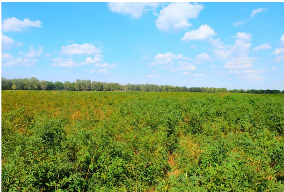
Рис. 1. Плоские русловые урочища среднего уровня с зарослями солодки голой (2 км к юго-западу от с. Черемуха)