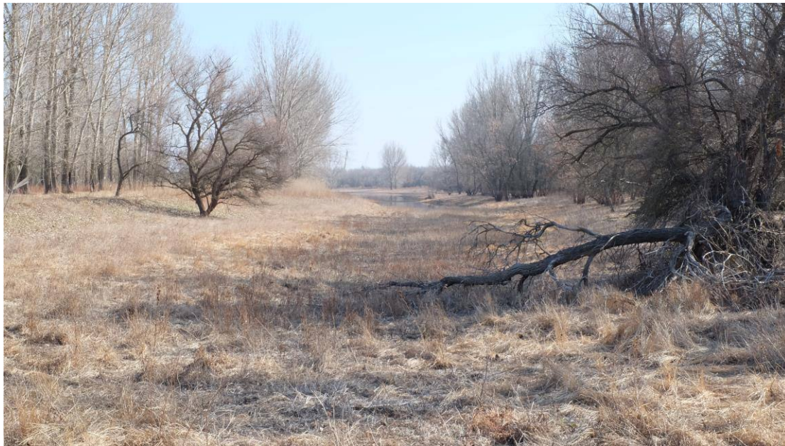
Рис. 2. Русловые гривистые урочища среднего уровня с искусственными лесопосадками (1 км к северу от п. Волго-Каспийский)

Образование русловых гривистых урочищ среднего уровня происходило на песчаных отложениях, на которых сформировались луговые слоистые почвы (рис. 2). Свежие луга по понижениям, на которых преобладают злаково-осоковые и солодковые ассоциации с осокой ранней ( Carex praecox Schreb.), солодкой голой ( Glycyrrhiza glabra L.) и пыреем ползучим ( Elytrigia repens L.), сменяются сухими свинойро-пырейными, в которых в случаях слабого засоления отмечаются галофиты.