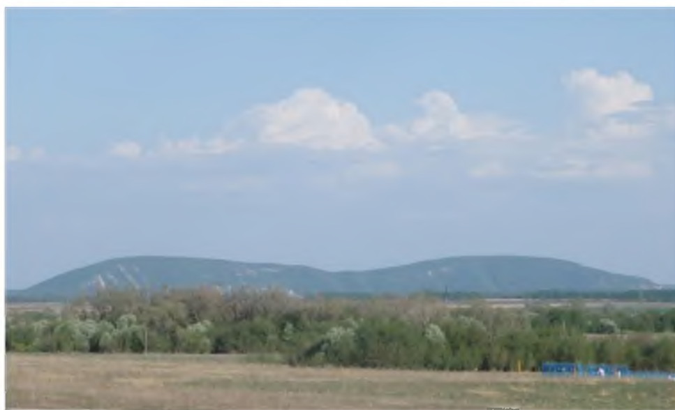
Рис. 1. Шихан Куштау (общий вид с западной стороны) Fig. 1. Shikhan Kushtau (general view from the western side)

Куштау – самый обширный по площади и наиболее облесенный шихан, имеет форму двугорбого хребта (рис. 1 и 2). Его протяженность с севера на юг 4 км, с запада на восток – 1–1.4 км. Со стороны западного и южного склонов его огибает р. Белая. Координаты южной вершины Куштау – 53.69^{\circ} с. ш., 56.08^{\circ} в. д.