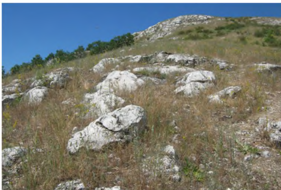
Рис. 4. Петрофитные степи южного склона Куштау Fig. 4. Stony steppes of the southern slope of Kushtau