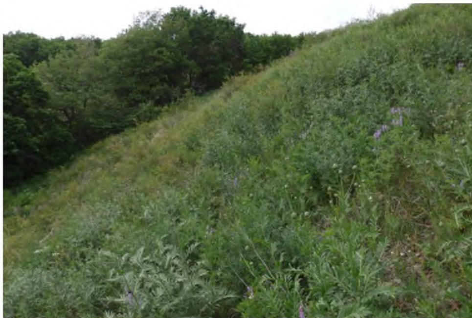
Рис. 5. Заросли василька русского ( Centaurea ruthenica Lam.) на юго-восточном склоне Куштау