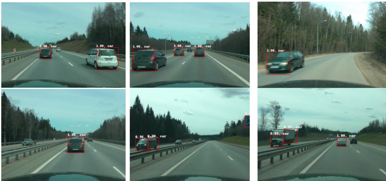
Рис. 4. Примеры обнаружения транспортных средств на изображениях загородных шоссе с помощью сверточной нейронной сети SSD300_VOC_Tuned Fig. 4. Examples of vehicles on the images of suburban highways using a convolutional neural network SSD300_VOC_Tuned

Такие результаты отражают факт, что чем больше различных изображений автомобилей (объектов) было использовано при обучении нейронной сети, тем выше результаты и качества распознавания. Также результат доказывает перспективность и необходимость пополнения обучающей выборки для создания качественных алгоритмов обнаружения объектов в различных условиях съемки.