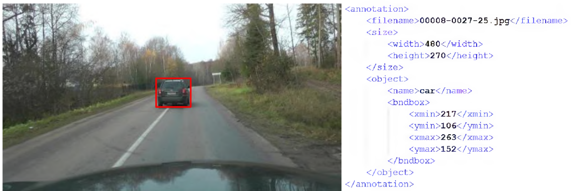
Рис. 1. Пример эталонной разметки изображений обучающей и тестовой выборки Fig. 1. An example of the reference marking of the images of the training and test samples

На рисунке 1 изображен пример разметки элемента обучающей выборки, на нем показано изображение и соответствующий ему файл разметки, который содержит такие данные как: имя файла изображения, его размер, имя класса, координаты верхнего левого и нижнего правого прямоугольника, содержащего объект.