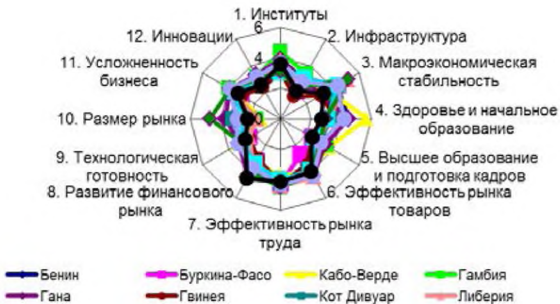
Рис. 2. Радиальные диаграммы укрупненных индикаторов конкурентоспособности для стран ECOWAS, 2013 г. Fig. 2. Aggregated indicators of competitiveness for the countries of ECOWAS, 2013