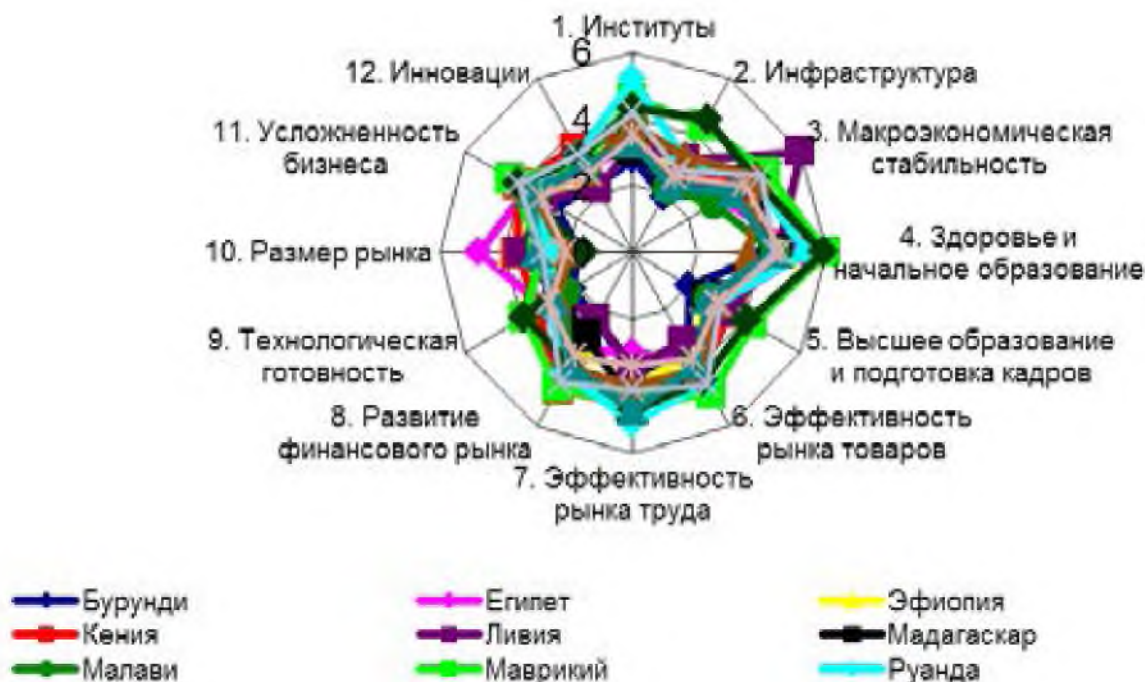
Рис. 1. Радиальные диаграммы укрупненных индикаторов конкурентоспособности для стран COMESA, 2013 г Fig.1. Aggregated indicators of competitiveness for the countries of COMESA, 2013