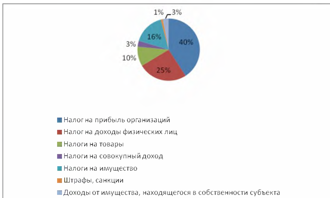
Рис. 1. Структура доходов бюджета Белгородской области на 2018 г. Fig. 1. The structure of revenues of the Belgorod region in 2018

Так консолидированный бюджет Белгородской области на 2018 год можно представить следующим образом.