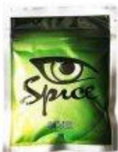
Рис. 8. «СПАЙС» сорта «Silver» в упаковке.

- Silver , то есть серебро. Среди всех «СПАЙСов» они наиболее слабые и безопасные, их действие длится около часа (Рис. 8)