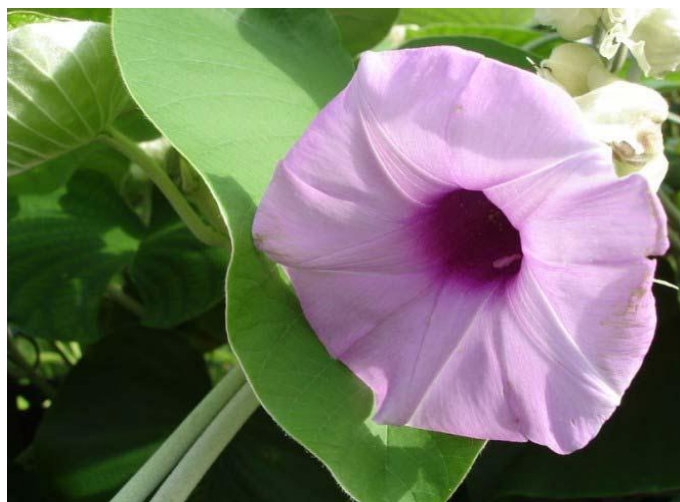
Рис. 1.2 Гавайская роза.

Тринадцать или четырнадцать семян гавайской розы являются максимальной психоактивной дозировкой. Самой высокой дозировкой, является пятнадцать семян гавайской розы (Рис. 1.2).