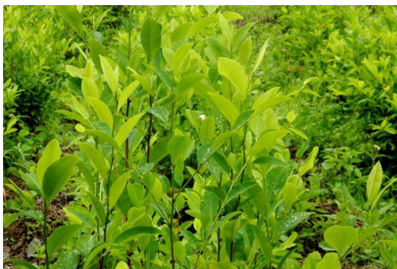
Рис.1. 5 Кокаиновый куст.

Собранные листья коки высушивают, после чего обрабатывают щелочным раствором извести, в результате чего из листа выделяются 14 алкалоидов. После этого сутки лист вымачивают в керосине, затем добавляют раствор серной кислоты. На дне оседает паста коки содержание кокаина от 40 до 90%, имеющая беловатый, кремовый или бежевый цвет 2 (Рис. 1.5).