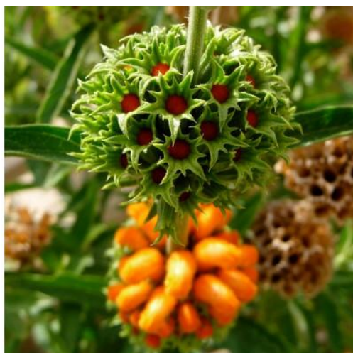
Рис. 1.4 Львиный хвост.

Львиный хвост – многолетний высокий кустарник, приблизительно до 2 м (некоторые экземпляры достигают высоты 3 м). Стебель волосатый и морщинистый. Листья округлые, пальчатые до 6 см в длину. Цветет с сентября по ноябрь красивыми оранжевыми, шерстистыми волосатыми цветами. Листья растения используются племенами Африки как седативное и желчегонное средство, а также для курения. Обладает наркотическим действием (Рис.1. 4).