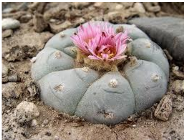
Рис. 1.7 Пейот.

На территорию Российской Федерации вышеперечисленные растения, содержащие в себе психоактивные вещества, ввозятся в сухом и измельченном виде. Как правило сотрудники таможенных служб обнаруживают пакетики с измельченными растениями примотанными к телу перевозчика либо в потайных карманах багажа. В обнаружении нелегального ввоза большую помощь оказывают служебные собаки.