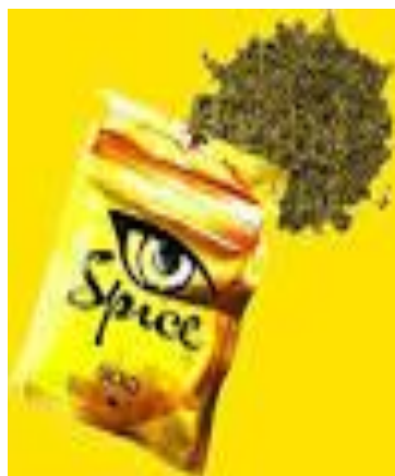
Рис. 9. «СПАЙС» сорта «Gold» в упаковке.

- Gold – средней силы смеси, вызывают выраженную эйфорию, появление образов и картинок, действуют около трех часов (Рис. 9).