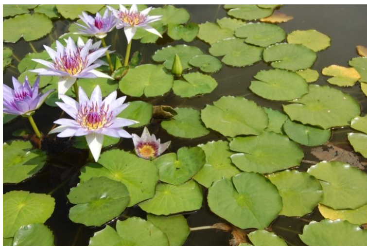
Рис. 1.3 Голубой лотос.

Львиный хвост – многолетний высокий кустарник, приблизительно до 2 м (некоторые экземпляры достигают высоты 3 м). Стебель волосатый и морщинистый. Листья округлые, пальчатые до 6 см в длину. Цветет с сентября по ноябрь красивыми оранжевыми, шерстистыми волосатыми цветами. Листья растения используются племенами Африки как седативное и желчегонное средство, а также для курения. Обладает наркотическим действием (Рис.1. 4).