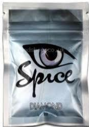
Рис. 10 «СПАЙС» сорта « Diamond » в упаковке.

представляет синтезированный наркотик, который продается под прикрытием травяной смеси 1 (Рис. 10).