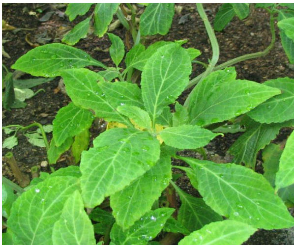
Рис. 1.1 Шалфей предсказателей.

Листья простые, цельные, овальной формы, могут достигать 20 см. Имеют изумрудно-зелёную окраску, покрыты короткими волосками. Край листа – зубчатый. Характер расположения листьев – супротивный. Цветы сложно мутовчатые, с типичной для губоцветных формой, с белыми лепестками и пурпурными тычинками, на конце стебля собраны в колосовидные соцветия (Рис.1.1).