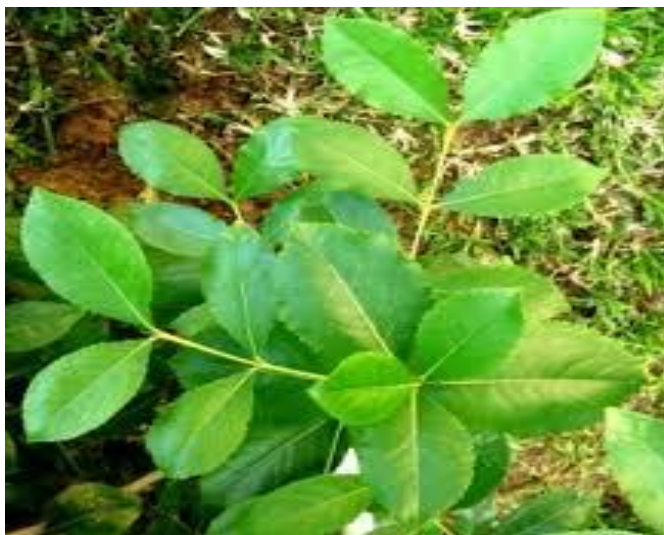
Рис. 1.6. Кат.

Пейот – маленький, слегка уплощенный, без колючек кактус. Основной активный компонент – галлюциноген мескалин. Мескалин может быть извлечен из растительного сырья или произведен искусственно путём синтеза изгалловой кислоты или другим способом. Для употребления пейотов срезают плоские верхушки кактусов, расположенные над поверхностью почвы и высушивают их. Сушеные кактусы жуют. Для достижения галлюциногенного эффекта необходимо принять 10-20 высушенных кактусов. Это эквивалентно дозе для мескалина – приблизительно от 0,3 до 0,5 граммов (около 5 граммов высушенного материала). Эффект продолжается приблизительно 12 часов. Возможны иллюзии и галлюцинации, повышение температуры тела, резкие скачки артериального давления, измененное восприятие времени и расстояния. В случае передозировки, наблюдался более длительный и более интенсивный период действия, психоз, поведение несоответствующее реальности, возможна смерть 1 (Рис. 1.7).