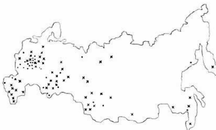
Рис. 1. Карта жесткости водопроводной воды в городах России. Условные обозначения: x – вода средней жесткости; • – жесткая; ▲ – очень жесткая

Для Центрального региона одной из таких особенностей химического состава природной воды, используемой для питьевых целей, является повышенная общая жесткость (рис. 1) [2].