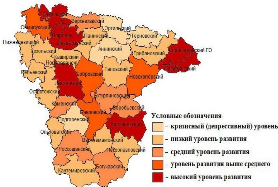
Рис. 2. Интегральная оценка уровня дифференциации социально-экономического развития муниципалитетов Воронежской области Fig. 2. Integral assessment of the level of differentiation of socio-economic development of the Voronezh region municipalities

Однако, несмотря на значительное количество научных исследований в рамках этой тематики, существует целый ряд нерешённых проблем в преодолении диспропорций в развитии регионов России и их муниципалитетов, что и обуславливает актуальность этого исследования. В соответствии с проведёнными расчётами, на основе предложенного алгоритма (см. рис. 1) и научно-методического комплекса изучения уровня дифференциации социально-экономического развития, все муниципальные образования Воронежской области были распределены на пять групп в соответствии с уровнем развития: высоким, выше среднего, средним, низким и кризисным (депрессивным) (рис. 2).