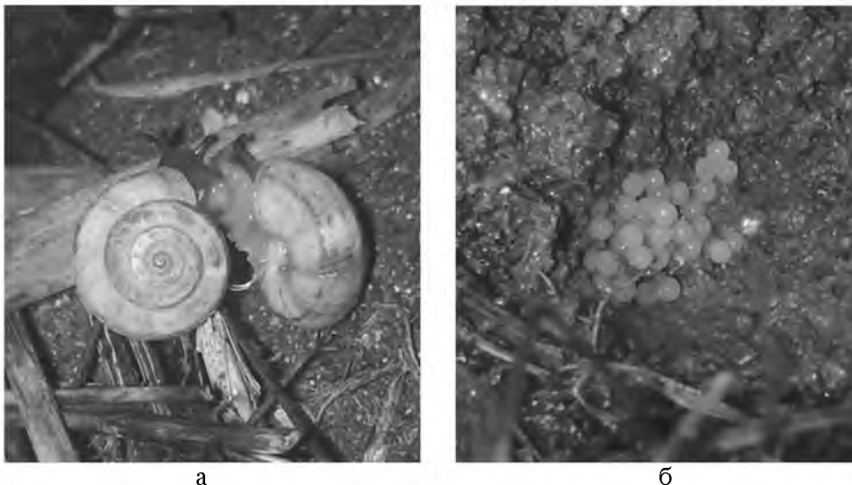
Рис. 2. Спаривание (а) и вскрытая кладка яиц (б) H. striata

микронетром измеряли их диаметр ( d_a ). Поскольку яйца H. striata имеют форму шара, то объем одного яйца ( V_a ) рассчитывали по формуле V_a = 4 \cdot 3.142 \cdot (d_a/2)^3 / 3 .