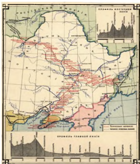
Рис. 2. Карта Китайской Восточной железной дороги. 1903 г. Fig. 2. Map of China Eastern Railway. 1903

Пожалуй, одним из самых сложных и отдалённых участков Великого Сибирского пути была Китайская Восточная железная дорога (КВЖД), проходившая по северной территории Китая – Маньчжурии (рис. 2). На обозначенную тему в российской и зарубежной историографии написано немало научных трудов, однако сведения о службе на КВЖД многих инженеров путей сообщения, таких как А.Н. Кулаков, до конца не изучены и по сей день.