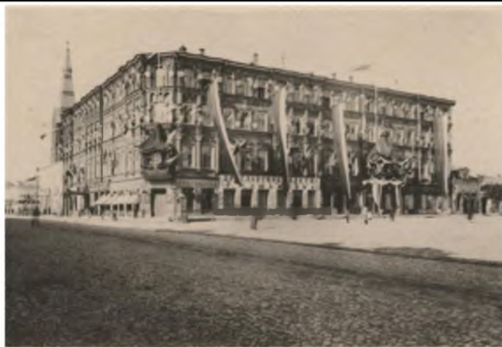
Рис. 4. Здание управления Рязанско-Уральской железной дороги в Москве. 1909 г.