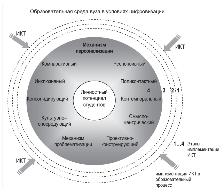
Рис. 2. Триггерные механизмы использования ИКТ в логике развития личностного потенциала студентов