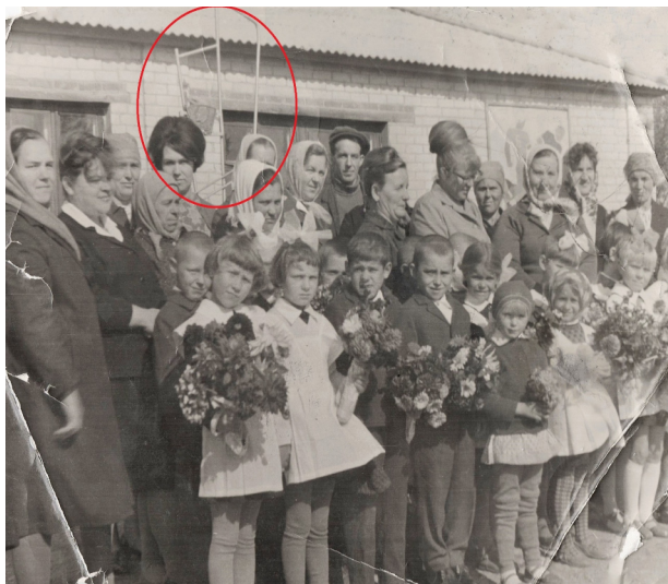
1 класс Алексеевской школы. 01.09.1970. (в круге часть конструкции места закладки капсулы времени).