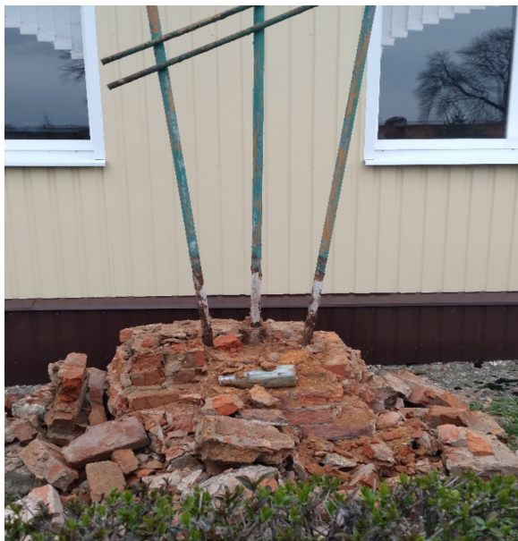
Извлечение капсулы времени. 13.04.2023.