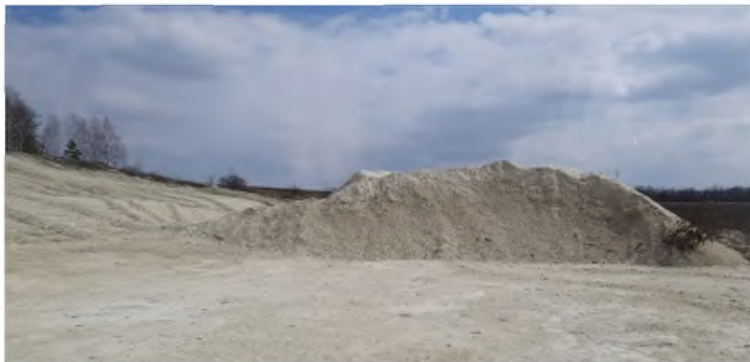
Рис. 2. Несанкционированный карьер по добыче мела вблизи п. Чернянка Белгородской области Fig. 2. An unauthorized chalk quarry near the village of Chernyanka, Belgorod region