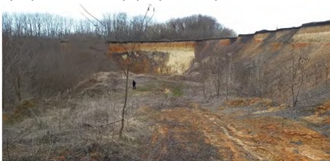
Рис. 1. Несанкционированный карьер по добыче песка в с. Курасовка Ивнянского района Белгородской области

Примеры обследованных карьеров приведены на рис. 1–3.