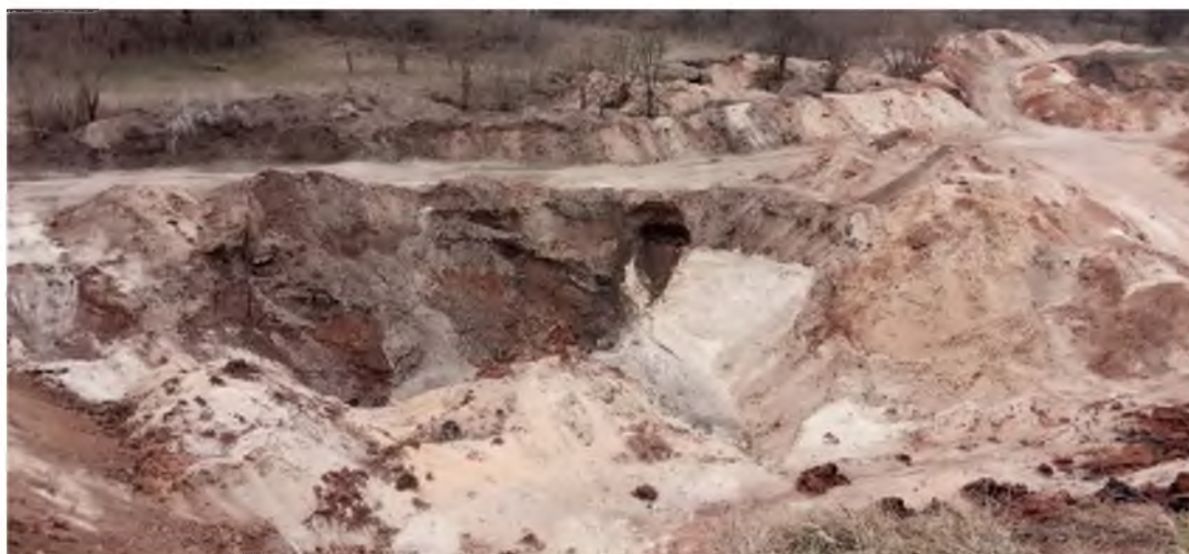
Рис. 3. Несанкционированный карьер по добыче песка в с. Афанасьевка Алексеевского городского округа Белгородской области Fig. 3. An unauthorized sand quarry in the village of Afanasyevka in the Alekseevsky city district of the Belgorod region

Все полученные материалы переданы администрациям муниципальных районов и городских округов области для разработки паспортов на карьеры, содержащих общие сведения о месторасположении, площади, фактическом состоянии и фотоматериалы на каждый несанкционированный карьер, а также для подготовки планов рекультивации земель, которые должны предусмотреть все необходимые этапы (технический и биологический) [Бортникова и др., 2018; О проведении рекультивации..., 2018].