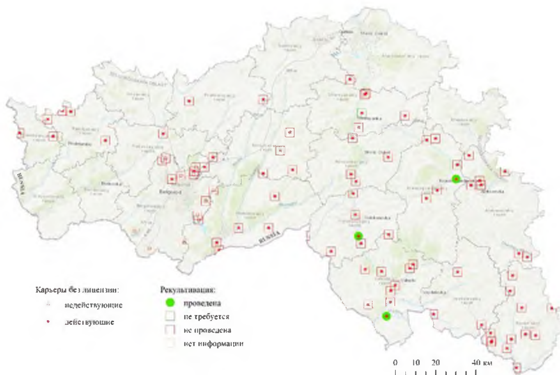
Рис. 4. Расположение несанкционированных карьеров по добыче общераспространённых полезных ископаемых, подлежащих рекультивации Fig. 4. Location of unauthorized quarries for the extraction of common minerals subject to reclamation

К сожалению, на территории региона контролирующими органами систематически фиксируются нарушения требований законодательства в сфере охраны недр (ст. 7.3 КоАП РФ) [Кодекс РФ ..., 2001]. Об этом говорится постоянно в докладах и отчётах регионального органа власти, осуществляющего геологический контроль [Управление экологического ..., 2024]. В данном исследовании была проанализирована динамика правонарушений в сфере недропользования за период с 2019 по 2023 год, которые выявлялись на территории Белгородской области практически в каждом муниципальном образовании. Данная динамика представлена в табл. 2. Хотелось бы отметить, что в данной сфере наблюдается рост нарушений и основными здесь являются: пользование недрами без лицензии (ч. 1 ст. 7.3 КоАП РФ) и невыполнение условий пользования недрами (ч. 2 ст. 7.3 КоАП РФ) [Кодекс РФ ..., 2001].