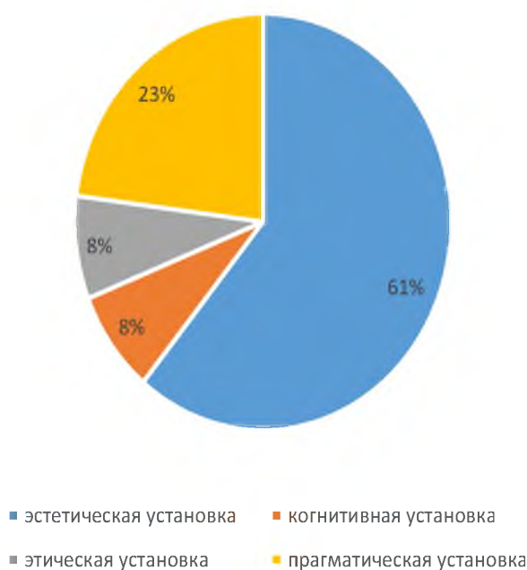
Рис. 1 Процентное соотношение типов экологической установки у студентов 2-го курса

Исследование проводилось на базе ОГАПОУ «Борисовский агропромышленный техникум» среди студентов 2 и 3 курсов, обучающихся по специальностям: 35.02.16 «Эксплуатация и ремонт сельскохозяйственной техники и оборудования», 23.02.03 «Техническое обслуживание и ремонт двигателей, систем и агрегатов автомобилей», 36.02.02 «Зоотехния», 38.02.01 «Экономика и бухгалтерский учёт (по отраслям), всего – 168 человек (2 курс – 85 чел., 3 курс – 83 чел.). Студентам был предложен текст, «состоящий из 12 пунктов. Каждый пункт содержал стимульное слово и пять слов для ассоциации. Четыре слова соответствовали четырем типам установки, пятое – для отвлечения внимания («мусорное слово»). Испытуемым предъявлялось стимульное слово, к которому предлагалось ассоциативно выбрать одно из пяти следующих, которое, по его мнению, больше всего к нему подходит. Слова предъявлялись в высоком темпе, испытуемые выбирали тот вариант, который первым пришел в голову. Этот вариант и характеризует доминирующую экологическую установку. Количество выборов того или иного типа представляется в процентном отношении от максимально возможного, а затем присваиваются соответствующие ранги 1, 2, 3, 4. Тип, установки, получивший наибольший удельный вес (1 ранг), рассматривается нами как ведущий у данной личности (обычно существует 2 преобладающих типа установок)» [3].