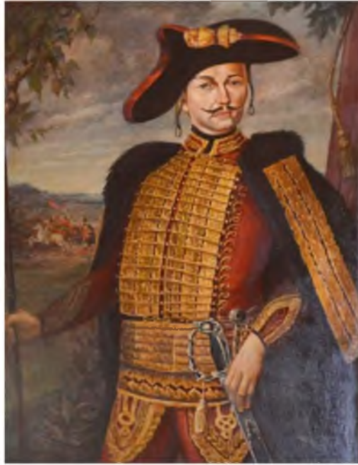
Рис. 3. Генерал Йован Самойлович Хорват Fig 3. General Jovan Samoilovich Horvath

Российский Сенат принял то же определение, и в последующие годы был издан ряд указов, определявших, что в Донской области могут селиться только поселенцы «из народов... сербской, македонской, болгарской и волосской (валашской) наций» и устанавливать и создавать колонии [ПСЗ, т. 13, с. 716]. В тех же декретах о колонизации и формировании воинских частей содержалась обязанность Хорвата сообщать о численности и составе полков.