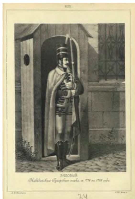
Рис. 6. Мундир солдата Македонского полка Fig 6. Uniform of a soldier of the Macedonian regiment

После нового формирования в 1766 г. Македонский полк имел униформу: желтые ментики с красными шнурами, желтые чакчиры, черный доломан, черные шапки с желтым галуном, черные фуражки с желтой подкладкой, желтые пояса с черными перемычками, черные ташки, серебряные пуговицы (рис. 6). 24 декабря 1776 г. (по О. Леонову, 16 января 1775 г.) произошло очередное изменение обмундирования гусарских полков.