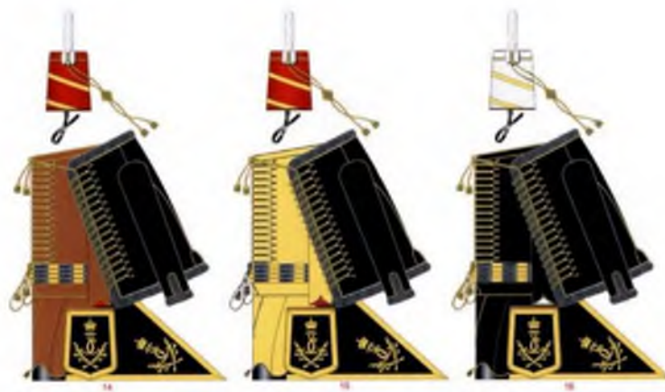
Рис. 5. Герб Македонского гусарского полка, утвержден в 1776 году Fig 5. The coat-of-arms of the Macedonian Hussar Regiment was approved in 1776

Русские документы свидетельствуют, что новый, Второй Македонский полк был создан 26.12.1776 г. и существовал до 28.06.1783 г., когда при новой реорганизации Македонский и Далматинский полки сливаются в новый Александрийский полк. Этот Второй Македонский полк имел также свой герб, который сохранился в книге «Гербы Полевых и поселенных Гусарских полков, с 1776 по 1783 гг.» 16 , но изображение не совсем такое, как в описании первого Македонского полка. Герб Македонского гусарского полка был утвержден в 1776 г.: «В красном поле серебряный щит, с различными орнаментами, а под ним две крестообразно лежащие деревянные стрелы с золотыми наконечниками» (рис. 5).