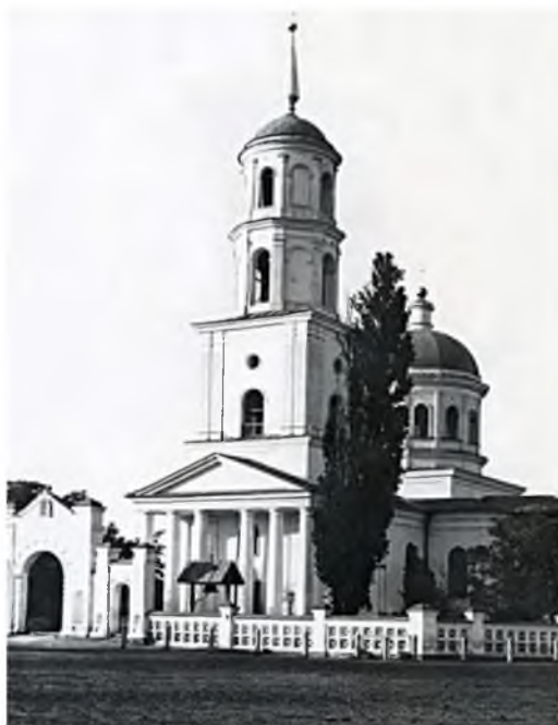
Рис. 4. Никольский собор в Новомиргороде. Возведено при поддержке генерала Хорвата Fig. 4. St. Nicholas Cathedral in Novomirgorod. Built with the support of General Horvath

Хорват прибыл в Киев в конце сентября 1751 г., а затем в октябре в Новомиргород (рис. 4). Для организации новых православных поселений Хорвата вызвали в Санкт-Петербург, где он представил свой проект перед императорским двором. После одобрения императрицы Елизаветы Петровны Сенат рассматривает его и в тот же день (24 декабря 1751 г.) утверждает проект. Через три недели, 11 января 1752 г., грамотой Военной коллегии Иван Хорват объявляется «генерал-майором» двух гусарских (кавалерийских) и двух пехотных полков, получивших наименование «Горватовский полк» или «Свободарский полк».